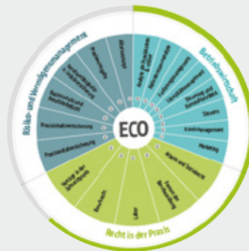
ZQMS ECO – Praxisführungsinstrument