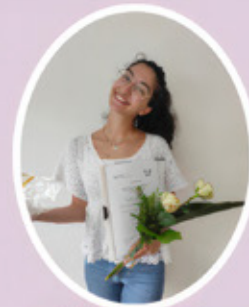
Challal, Hanna Ddent MVZ GmbH, Garrel