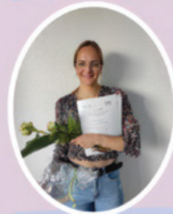
Garwels, Marina Dres. Linnenkämper/ Pöling, Dinklage