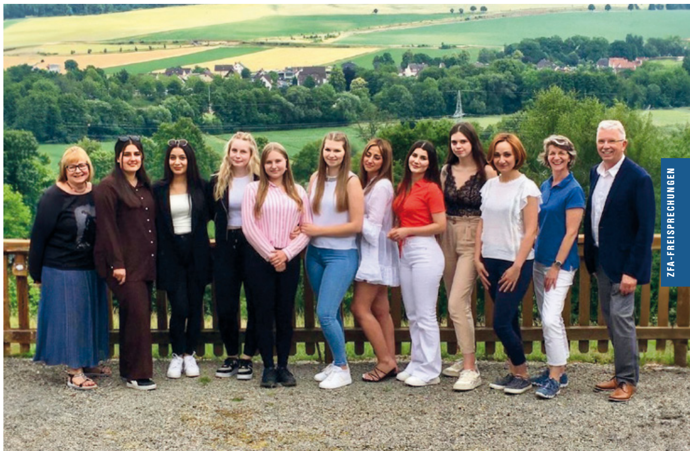
Die Prüflinge nach bestandener Prüfung mit ihren Prüfern.