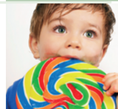
Dauerlutschen schadet den Zähnen